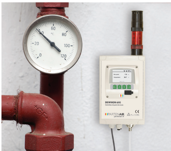
DEWMON avec alarme optionnelle visuelle et sonore