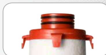
Code couleur éléments filtrants série PX5 : Rouge

(*) Débits indiqués selon ISO 7183 (20°C et 1 bar absolu) sous 7 bars relatifs