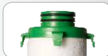
Code couleur éléments filtrants série PX5 : Vert

(*) Débits indiqués selon ISO 7183 (20°C et 1 bar absolu) sous 7 bars relatifs