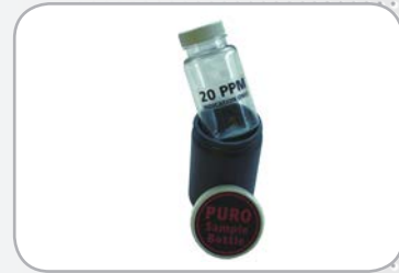
Kit de tests