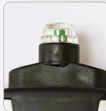
Indicateur de saturation.