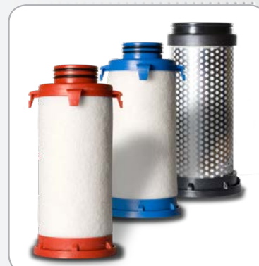
Eléments filtrants avec codes de couleur et numéros de lots pour traçabilité.