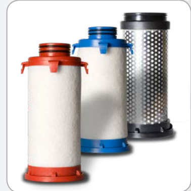
Eléments filtrants avec codes de couleur et numéros de lots pour traçabilité.

Débits indiqués selon ISO 7183 (20°C et 1 bar absolu) sous 7 bars relatifs