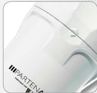
Nouveau bol avec butée de vissage - Évite tout sur-serrage, facilite la pose/dépose.

(*) Débits indiqués selon ISO 7183 (20°C et 1 bar absolu) sous 7 bars relatifs