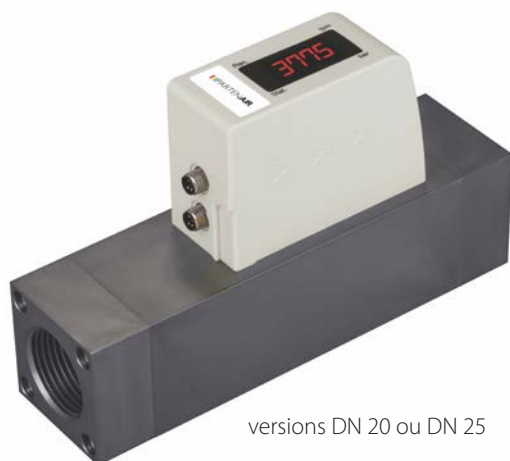
versions DN 20 ou DN 25

Les débitmètres FLOTIP modèle F500 et F800 sont conçus pour la mesure de débit aux points d'utilisation. Leur prix attractif vous permet de manière économique d' optimiser les systèmes de production et de réduire la consommation d'air comprimé et les coûts d'exploitation.