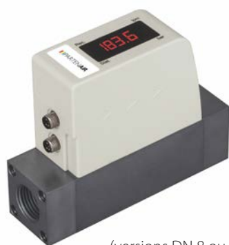
(versions DN 8 ou DN 15)