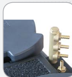
Adaptateur optionnel multi-entrées