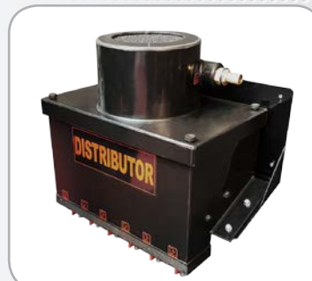
DISTRIBUTOR (option) : Permet la répartition uniforme des condensats sur plusieurs séparateurs Puro-Elite