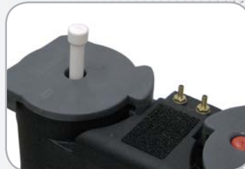
Indicateurs de saturation et de surcharge