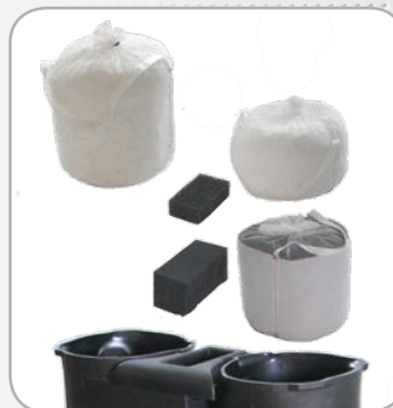
Éléments filtrants conçus pour un remplacement simple et sans effort.

* Nécessite un adsorbant spécifique et une réduction du débit traité. Nous consulter pour ces applications.