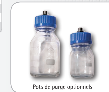
Pots de purge optionnels