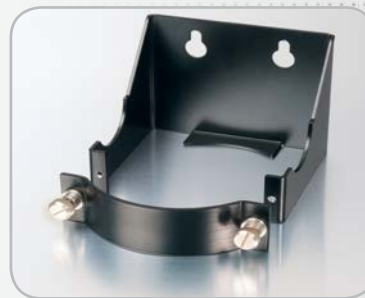
Kit de fixation murale (Option)