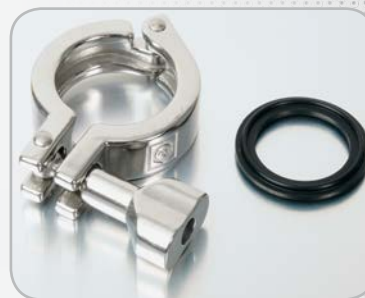
Kits d'assemblage (Option)