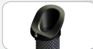
Code couleur éléments filtrants série CF : Noir