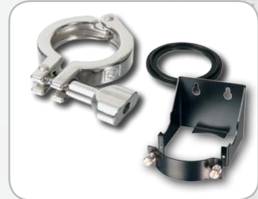
Kits d'assemblage et fixation murale (Option)