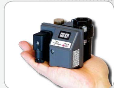
Purgeur Captair Compact optionnel recommandé pour modèles 13 à 17.