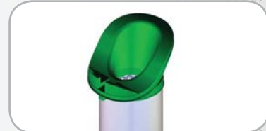
Code couleur éléments filtrants série HF : Vert