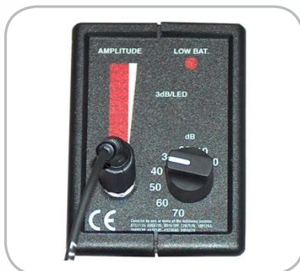
Indicateur visuel à LED Témoin de batterie et réglage de sensibilité