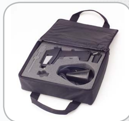
Fourni avec mallette de transport anti-choc comprenant tous les accessoires nécessaires.