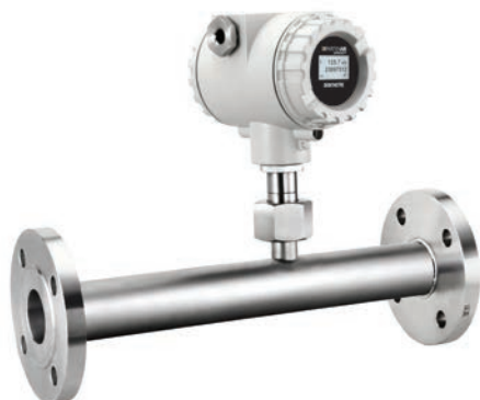
Egalement disponibles assemblés sur section de mesure

En règle générale, tous les mélanges de gaz dont la composition est connue et constante peuvent être mesurés à l'aide du FLOPRO.