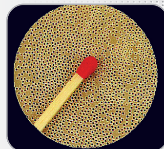
Membranes à l'échelle