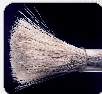
Faisceau de membranes